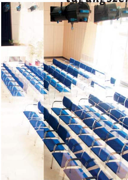
Konferenzraum für 250 Personen