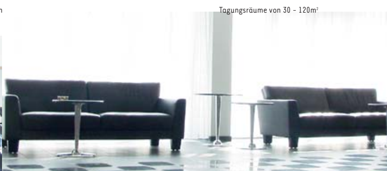
Tagungsräume von 30 - 120m 2